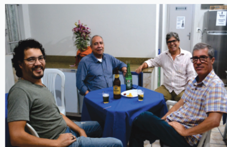
Professores na última edição “Quintas Culturais”