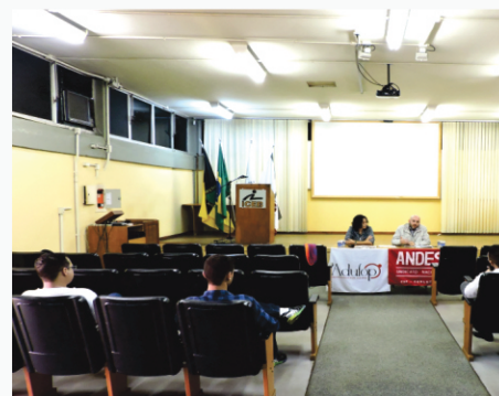
Assembleias Setoriais em João Monlevade, Mariana e Ouro Preto