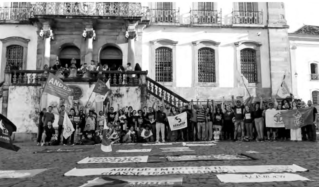
Ato na Praça Tiradentes no Dia Nacional de Lutas em Defesa das Universidades, em 9 de maio de 2024.

do individualismo e da apatia social no pós-pandemia de Covid-19 não foi – e segue não sendo – uma tarefa fácil, mas uma tarefa que exige sobretudo um esforço pela coletividade; as cicatrizes da não-socialização nos explicitam um território de extrema fragilidade e sensibilidade sociais e subjetivas. A greve unificada de 2024 cumpriu um papel fundamental de retomada da esperança política, sufocada por anos com o avanço do neoliberalismo e (des)governos que não abriam margem para conquistas da classe trabalhadora. Além disso, trouxe novamente à tona o sentido coletivo de lutar e de viver. Nesse sentido, os estudantes organizados na UFOP amotinaram suas perspectivas artísticas, culturais e pedagógicas na execução de um plano de atividades que buscaram tornar viva e cotidiana a luta por uma universidade e uma sociedade radicalmente diferentes.